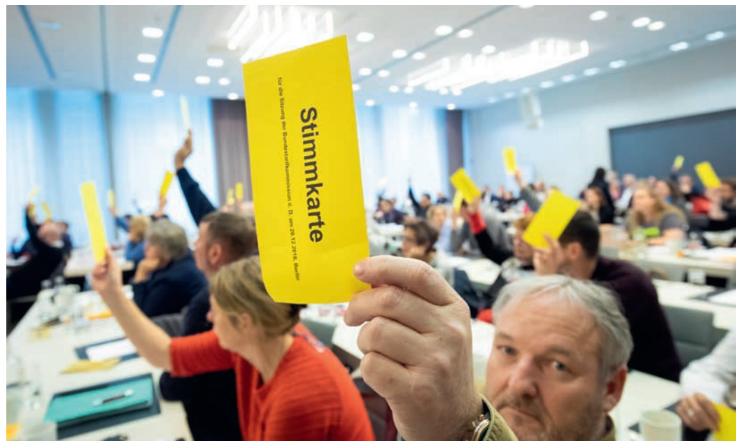
Mehr Geld muss her: Abstimmung der ver.di-Bundestarifkommission in Berlin

Die Beschäftigten in den Landesverwaltungen, Unikliniken, Straßenmeistereien, Küstenschutz oder im Sozial- und Erziehungsdienst, bei Gerichten und im Justizvollzugsdienst erbringen mit ihrer Arbeit, täglich einen wichtigen Beitrag für einen funktionierenden öffentlichen Dienst der Länder. Diese Leistung muss sich auch in den monatlichen Entgelten widerspiegeln. Sie haben auch ein Recht, an wirtschaftlichem